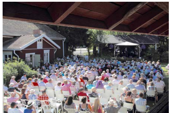
Konserttiyleisöä Hannulassa